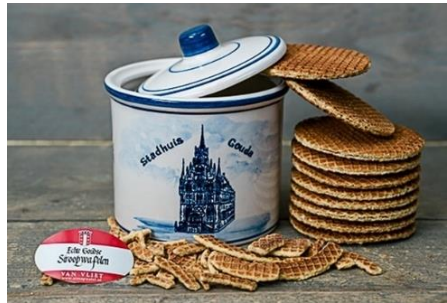
Siroopwafelbakkerij in Gouda