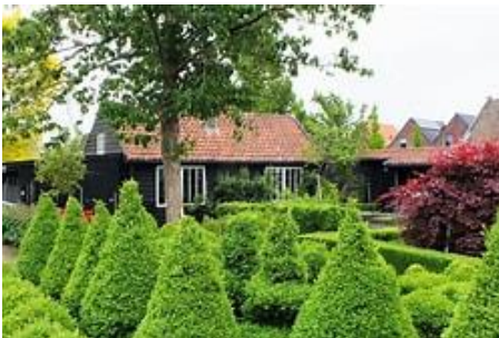
Boomkwekerijmuseum in Boskoop

De eerste dagtocht op woensdag 3 april zal gaan naar het boomkwekerijmuseum in Boskoop en een Goudse siroopwafelbakkerij. De aankondiging en het aanmeldingsformulier vindt u in dit afdelingsblad op blz. 1