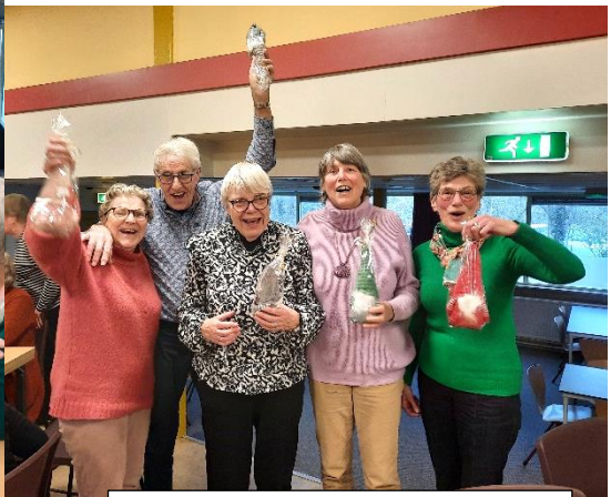
Blij met de leuke poedelprijs!