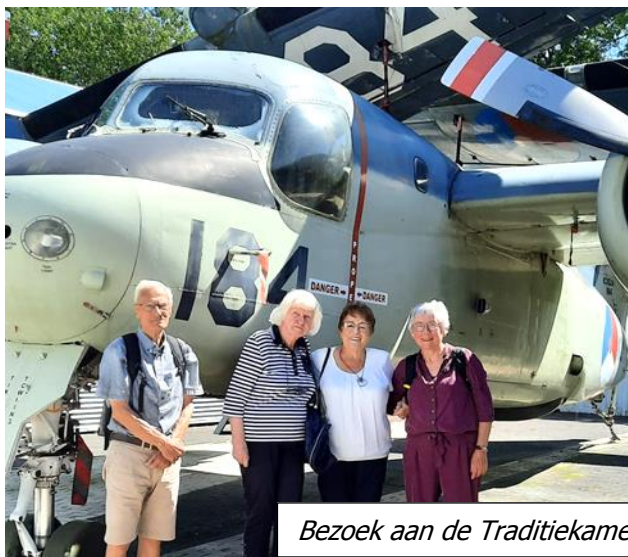
Bezoek aan de Traditiekamer